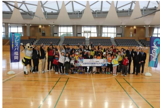
○地元プロスポーツチームとの連携した取組