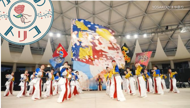
○プロモーション動画制作