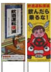
粕屋町内の主施設に飲酒運転撲滅の看板掲示中！

飲酒運転は犯罪です。 「飲酒運転撲滅宣言企業」 「飲酒運転撲滅宣言の店」 の輪を広げて飲酒運転ゼロ社会を実現させよう。