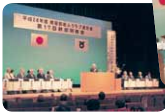
糟屋郡老人クラブ連合会 幹部研修会