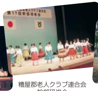
糟屋郡老人クラブ連合会 幹部研修会