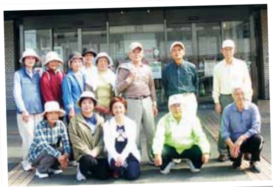
スマイルウォーキング会のみなさん

スマイルウォーキング会は、粕屋町のウォーキンググループです。現在、会員さんは約20名で、月2回1時間30分程度のウォーキングをしています。町民の方であればどなたでも参加できます。一緒に歩く仲間がいることでウォーキングも長続きしますよ。