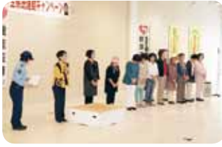
(西日本新聞に掲載されました)

夕暮れ時や夜間に外出するときは、車の運転者から見えやすい明るい服を着用し、黒っぽい服装には、明るい帽子やマフラー・反射材を着用しましょうと呼び掛けました。ドライバーの皆さんにも、夕暮れ時は早めにライトを点灯し私たちが歩行者を見つけてくださいとアピールしました。