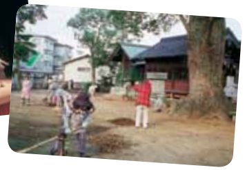
阿恵老人クラブ清掃奉仕作業