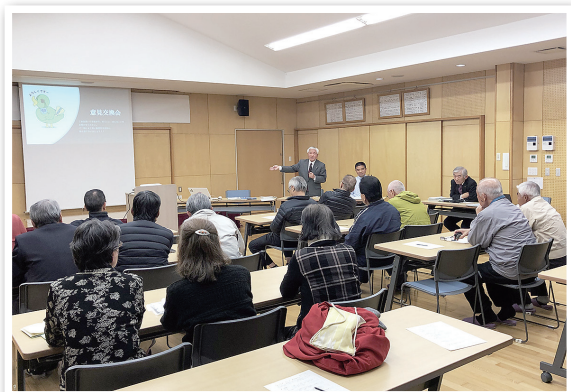
甲仲原公民館の様子

また、1部「決算報告」、2部「意見交換会」、及び全体的な主なご意見などの詳細はホームページをご覧ください。