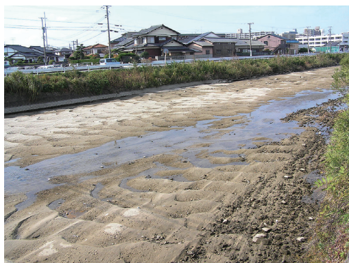
須恵川 阿恵橋北側の砂礫の堆積状況

内容としては、「本年度中に、扇橋下流域の一部、及び自在王堰から阿恵橋までの浚渫、護岸の伐木や堤防の草刈りなどを実施する。