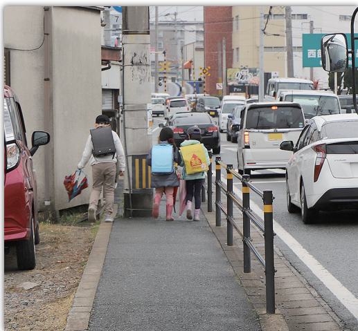
議会でも話題となる狭い歩道の電柱