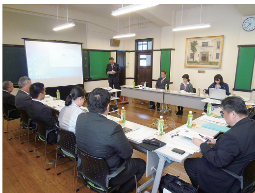
東洋一と言われた旧小学校校舎での説明(豊郷町)

粕屋町としても子育て支援の施策を、豊郷町の町単独事業の取り組みを調査・研究します。