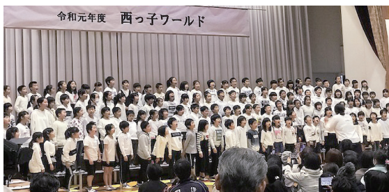
西っこワールドで歌う子どもたち

サンレイクを管理する業者に社会教育課ができるだけ移譲していきたいと考えています。町民の皆さんに啓発しながら一緒にやっていくことが大事だろうと思います。