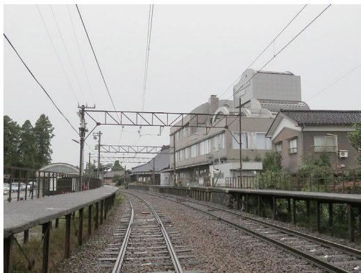
舟橋駅に併設されている村立図書館

役場職員も30人ほどの中で、人口増加を狙った公園建設計画などこれから見習うべき施策が多々ありました。