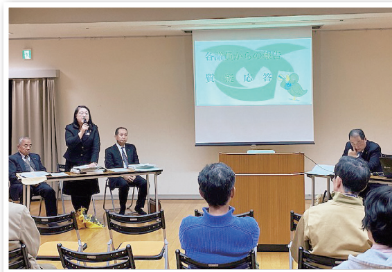
原町公民館の様子