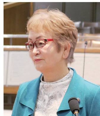
本田 芳枝 議員