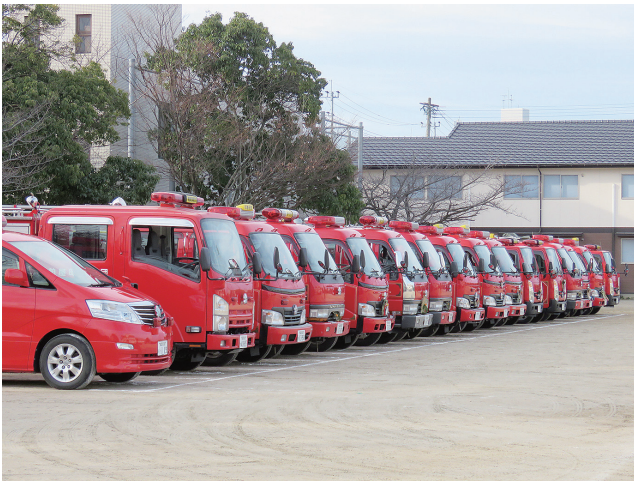
整列している消防ポンプ車