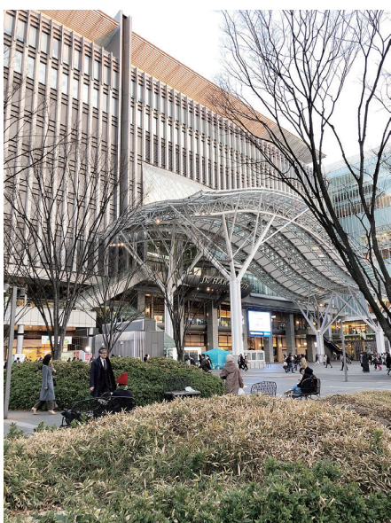
駅を中心とした夢のあるまちづくりを(JR博多駅)

また、企業誘致や工場などの集約化を図ることによって、町の活性化、雇用の拡大にも寄与し、産業発展による新製品の開発にも繋がるのではないのでしょうか。