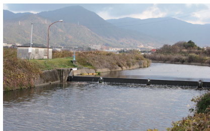
ワイヤーが切れ、水を溜められない脇田井堰