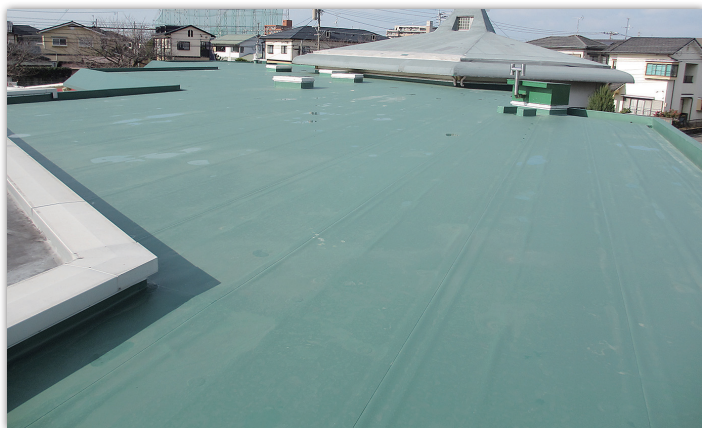
屋根防水改修工事完了

議員から、工事後、大雨が降ったりしたが、雨漏りは無かったかなどの質問があり、11月下旬の工事終了からは雨漏りはないとの報告でした。