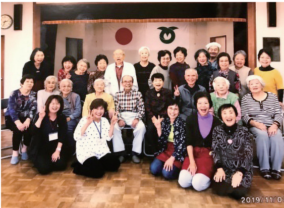
笑顔が素敵な利用者の皆様