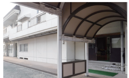
バリアフリー化工事でスロープ設置予定箇所