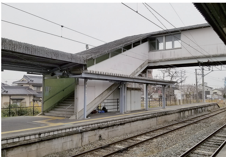
30段の階段があるJR原町駅

利用者の方々のそういう強い要望があるという後押しをしていただければ、私も強くいえます。また、国のほうに直接働きかけることも今後やっていききたいと思っています。