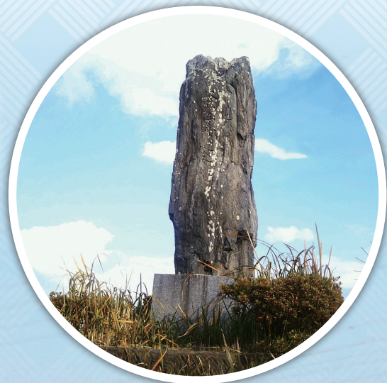
もうたいけ 大正三年建立毛田池記念碑 (内橋3区内)