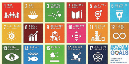
「誰一人取り残さない持続可能な世界」を