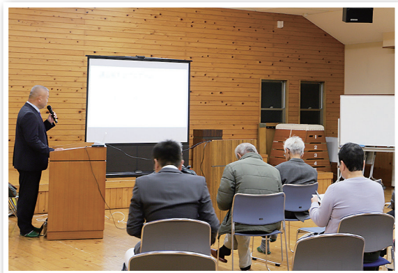
戸原公民館の様子