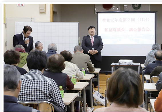
乙仲原西公民館の様子