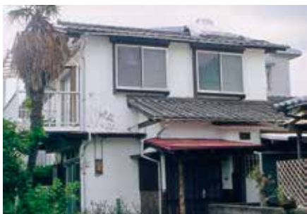
40坪の土地 建ぺい率60% 容積率40%に建つ家

次年度のマスタープランの中間見直しは、現行が平成22年策定であるため、10年後の平成32年となり、その2年くらい前から準備にとりかかかかる予定です。