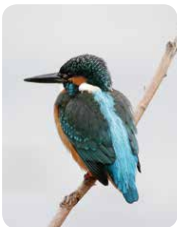
多々良川に棲むカワセミ