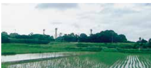
駕与丁公園グランドと隣接する2,700㎡もある森のような墓地

墓地の件は、行政は継続ですから、前町長が約束されているかどうかを確認し、今後もう一度精査した上で報告します。