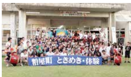
柏屋町ときめき・体験

未来を担う子どもたちを育む町づくりを政策の柱として掲げ、青少年の健全育成や生涯学習の推進を図ってまいります。