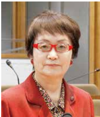
本田 芳枝 議員