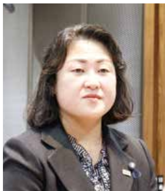
木村 優子 議員