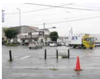
上大隈区谷がに交差点

やはり(古賀方向からの)右折を回避しても、(和田方向からの)直線だけでも多くの車輛が入って来るかと認識します。もう一回要望などを考えさせていただきたいと思えます。