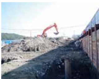
給食センター廃棄物撤去

先般弁護士の方に、この件を相談しましたが、議会の説明用として職員が作ったもので、偽造にあたるらないという事でした。