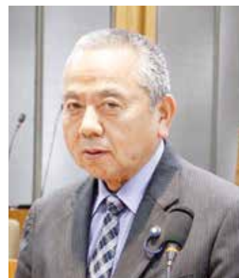
久我 純治 議員