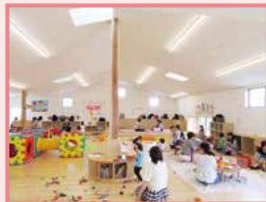
子育て支援ルーム「つどい」