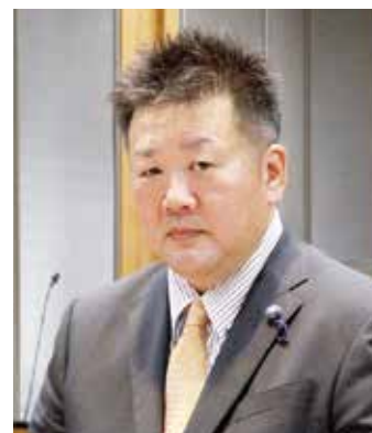
安藤 和寿 議員