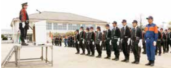
柏屋町消防団入退団式