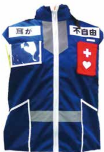
東京粕江市の聴覚障がい者用災害ベスト