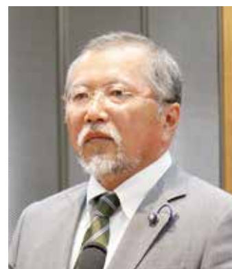
中野 敏郎 議員