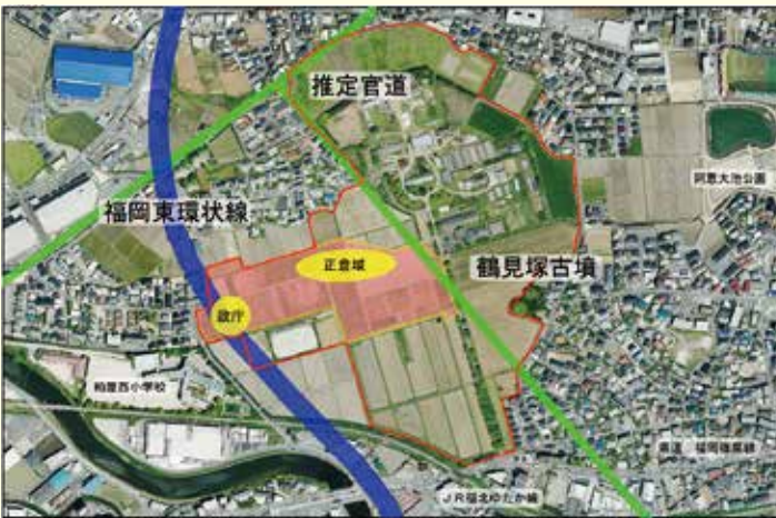
開発が待たれる九州大学農場跡地