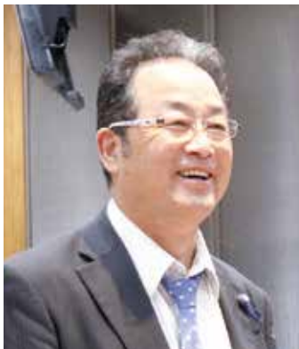
山脇 秀隆 議員