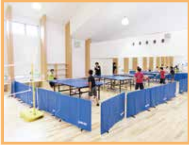
利用者に人気が高い部屋 「動こうスペース」

5月16日にオープンして、6月末現在で約7,000の方が利用し、登録人数は2,500人を超えました!!